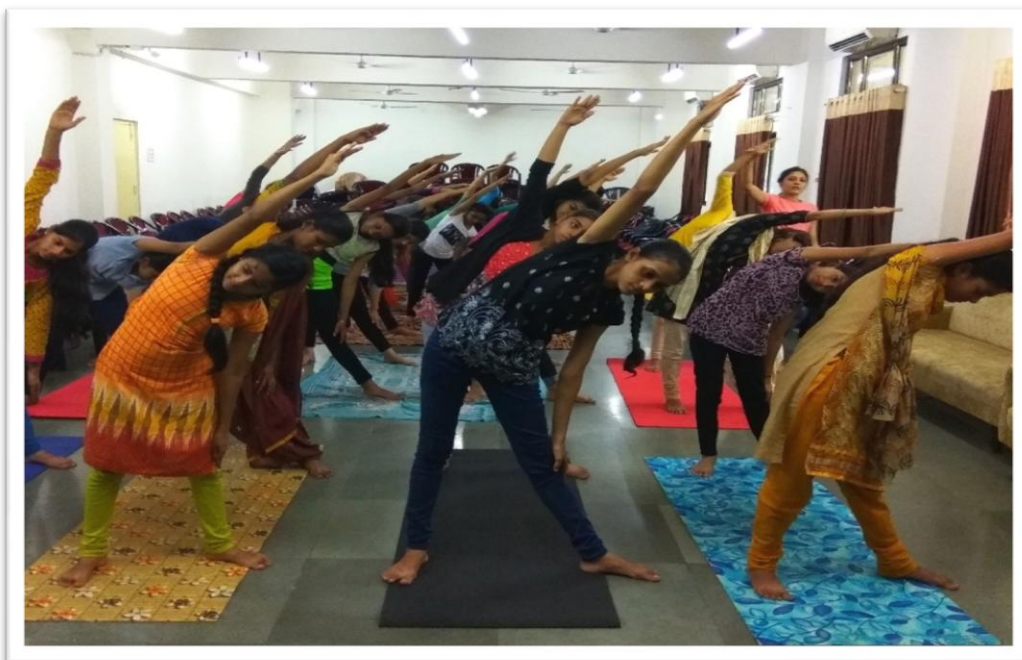
Girls performing Yoga during the Workshop