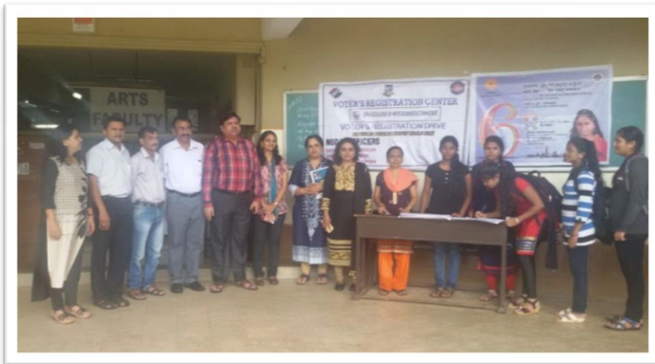
Voter ID Card enrolment drive from 1 st to 31 st July 2017

NSS unit always strives behind creating a responsible citizen through their activities. The National Service Scheme (NSS) Units of Birla College organized a Voter Id Card Enrolment drive in the month of July. More than 2000 students enrolled their names. The college motivated students to become a responsible citizen by having an election card and framing the importance of democracy elaborating the value of their vote. It is the objective of NSS to develop amongst students a sense of civic and social responsibility. The drive was successfully conducted under the guidance of NSS Program officers Dr. Mahadeo Yadav, Dr. Seema Manchanda and Mr. Nagesh Pawar.