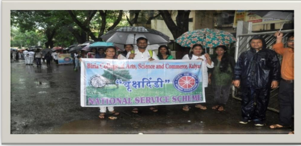
Students Participating in Vruksh Dindi